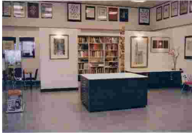
Das Karlgeorg und Maria Hofer Archiv in Offenbach-Rumpenheim, Kleines Gäßchen 13-15